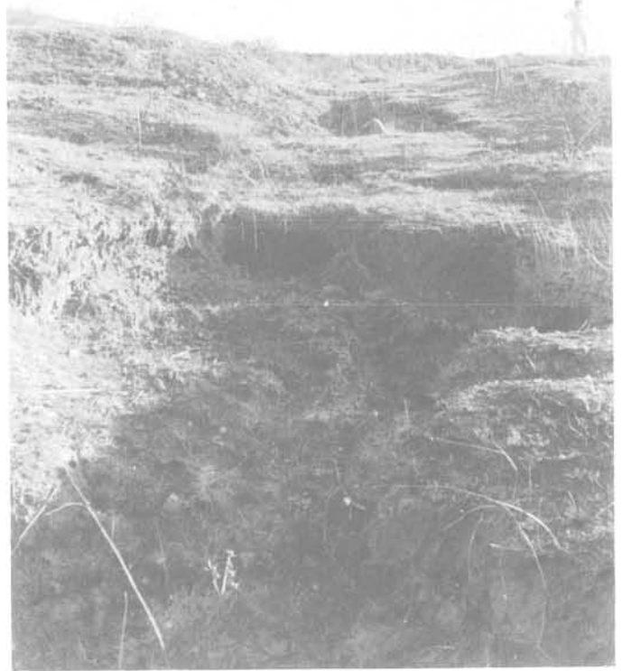
Fig. 6 - Soutirage dans un exutoire.

Parfois l'exutoire est sur un ancien glissement qui se trouve réactivé, le fond de l'exutoire s'effondre par soutirage, tandis que les eaux s'infiltrèrent profondément et créent un glissement de grande ampleur (figures 6 et 7).