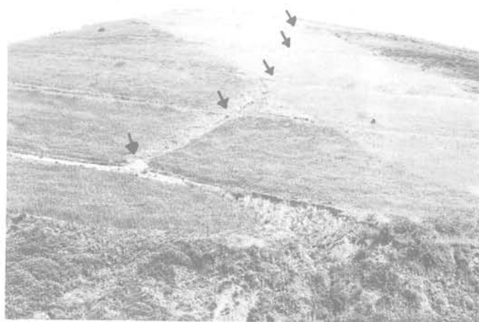
Fig. 3 - Coupure des banquettes par glissement du talus et du bourrelet, puis ravinement. Le phénomène a débuté au bas de la pente, puis par érosion régressive a gagné en amont ; la banquette la plus haute est à peine entamée (Borj Menaïel).

Les glissements entraînent la destruction de la banquette d'autant plus facilement qu'ils facilitent l'érosion par ruissellement (figure 3).