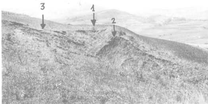
Fig. 5 - 1-Ravinement à l'embouchure d'une banquette 2-Sapement latéral du bourrelet. 3-Sapement du talus puis de l'interbanquette par érosion régressive (Bordj Menaïel).

Le débouché des banquettes sur l'exutoire est le point le plus fragile de l'ouvrage, trop souvent non aménagé il est alors rapidement raviné, le bourrelet sapé à la base glisse, la ravine s'élargit, s'approfondit et gagne vers l'amont, elle finit par saper le talus, puis l'interbanquette, d'année en année le ravinement progresse vers l'amont (figure 5).