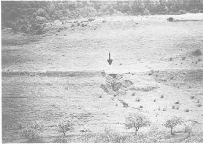
Fig. 4 - Glissement du bourrelet et de son substratum (Bordj Menaïel).

NB - remarquer le ravinement important dans le glissement et les ondulations importantes révélant l'instabilité du versant.