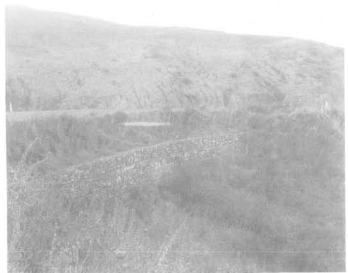
Fig. 7 - Glissement provoqué par l'infiltration des eaux dans la partie amont d'un exutoire.