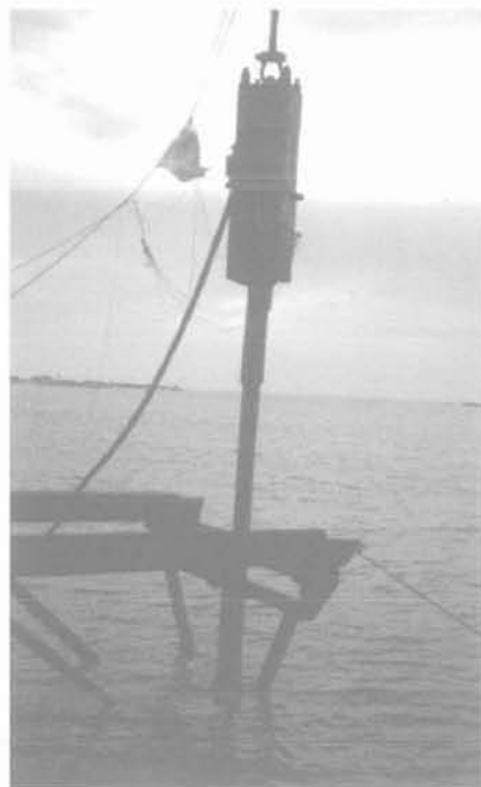
FIG. 3 Mise en œuvre du système d'ancrage à forte capacité de tenue par battage usuel à l'aide d'un faux pieu tubulaire récupérable en fin d'opération. Installation of the high holding capacity anchoring system using standard pile driving techniques with a follower, recovered after installation.

De très nombreux essais en laboratoire et en place ont mis en évidence deux principaux mécanismes de rupture caractérisant le volume de sol mis à contribution :