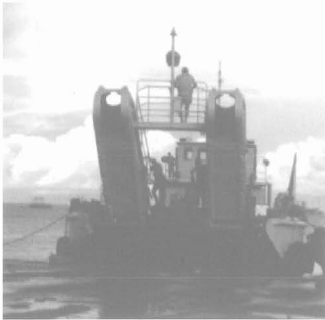
FIG. 4 Évaluation en vraie grandeur de la performance mécanique d'un système d'ancrage à forte capacité de tenue. Full scale proof experimentation on high holding capacity anchoring system.

3 mois d'intervalle. Des forces plus grandes auraient cassé les orins.