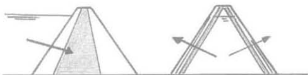
FIG. 3 Coupes schématiques comparées d'un volcan, et d'un barrage en remblai ; l'eau extérieure exerce une poussée dirigée vers le bas sur le noyau « étanche » placé au centre du barrage, alors que l'eau intérieure exerce une poussée vers le haut sur des couches « étanches » proches des pentes du volcan (échelles différentes).

La pente d'un volcan peut être schématisée par des couches parallèles de perméabilités différentes (Fig. 3) ; la pression d'écoulement se concentre, surtout en régime transitoire, sur les surfaces de contraste (dans le sens de plus à moins perméable). Il y a donc lieu de comparer l'intensité de la pluie et la perméabilité des couches les moins perméables : l'intensité d'une pluie