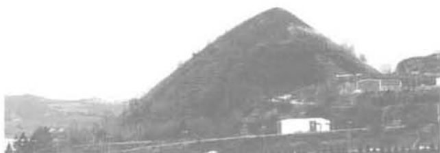
FIG. 2 Le terril du Soleil à Saint-Étienne. Soleil mine refuse heap, in Saint Etienne city, France.

sujettes aux glissements de terrain, même en dehors de toute manifestation du volcanisme ; ainsi presque tous les volcans présentent des cicatrices de glissements de terrains, soulignées par la neige sur la figure 1. L'article est donc consacré aux caractères communs aux terrils anthropiques et aux volcans, que l'on doit considérer comme des terrils volcaniques .