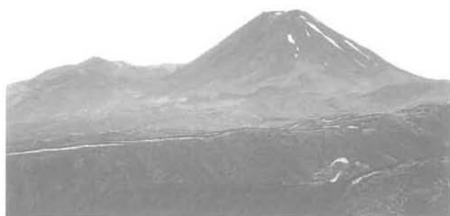
FIG. 1 Le volcan Tangariro ; Nouvelle-Zélande. Volcano Tangariro, New Zealand.

Le glissement catastrophique du volcan japonais Ontake, le 14 septembre 1984 (Duffaut, 1987) montre que les pentes des volcans sont particulièrement